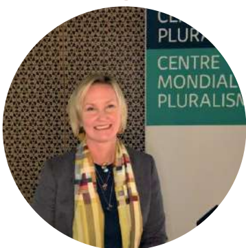
De haut en bas : Musée Bytown, Black History Ottawa Kitigan Zibi Anishinabeg Pimadjiwiniwogamig, Centre mondial du pluralisme.