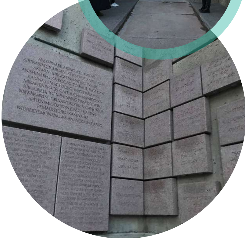
Photo : Intérieur, Hommage canadien aux droits de la personne.

Connexion Patrimoine de la Capitale rend hommage à tous les peuples des Premières Nations, des Inuits et des Métis et à leurs précieuses contributions passées et présentes à cette terre.