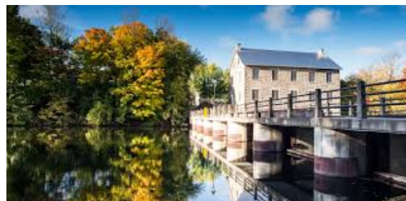
Lieu historique national du domaine Billings (gauche) et le Moulin Watson (droite)

Juste avant la longue fin de semaine, nous avons eu le plaisir de conclure notre programme de mentorat du patrimoine de la capitale et de discuter comment bâtir sur les succès de ce projet-pilote.