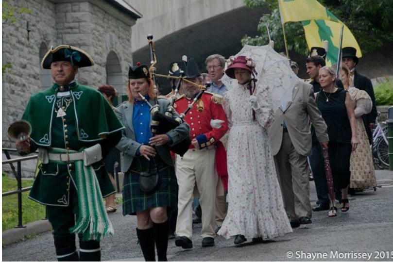
Journées Bytown Days 2015